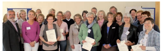
Zertifikatübergabe in der Fabi